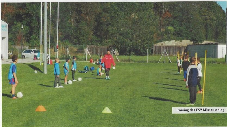
Training des ESV Mürrzuschlag.

Die ASKÖ und ihre Mitgliedsvereine haben im Jahr 2019 eine Vielzahl von Bewegungseinheiten im Rahmen der Initiative „Sport verbindet uns!“ umgesetzt.